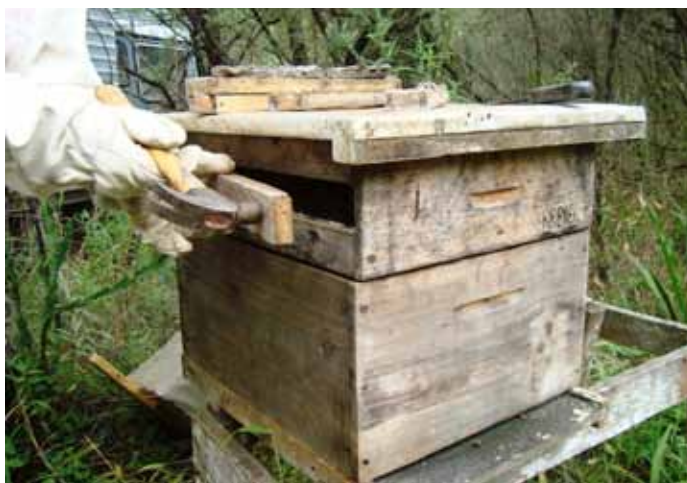
Figura 14. Fechamento do espaço do caixilho na melgueira

Terminado o período de produção de própolis (para a região sul do Brasil, com a chegada das primeiras frentes frias em meados de abril), são retiradas as melgueiras com os coletores. Nas colmeias mais populosas e com reserva de alimento na primeira melgueira, é retirado o quadro móvel e a abertura fechada com um tampo de encaixe justo (Figura 14). Este tampo não precisa ser pregado, pois será propolizado pelas abelhas. Nas próximas produções poderá ser retirado com facilidade.