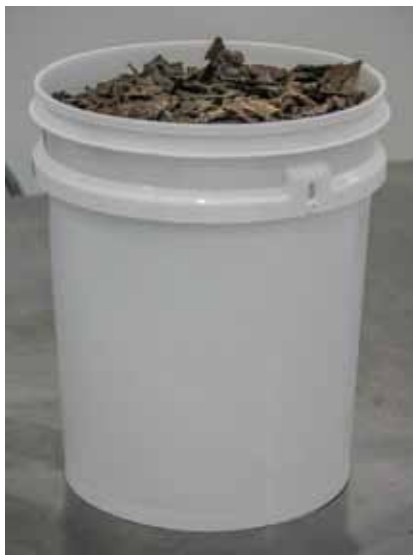
Figura 19. Baldes para acondicionamento de própolis nova

Também poderão ser utilizados baldes plásticos, herméticos, de grau alimentício, de cor branca opaca (para não haver entrada de luz), com capacidade de até 10 kg de própolis (baldes para 20 litros), conforme Figura 19.