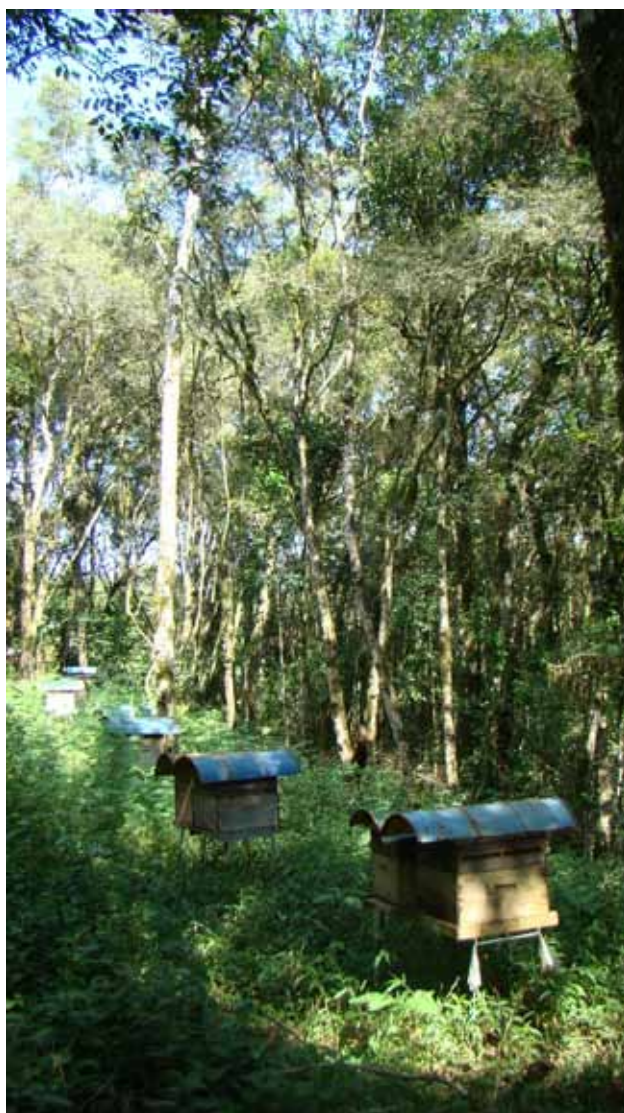
Figura 3. Localização do apiário

Recomenda-se deixar as colmeias protegidas do sol (meia sombra) nos períodos mais quentes do ano (Figura 3).