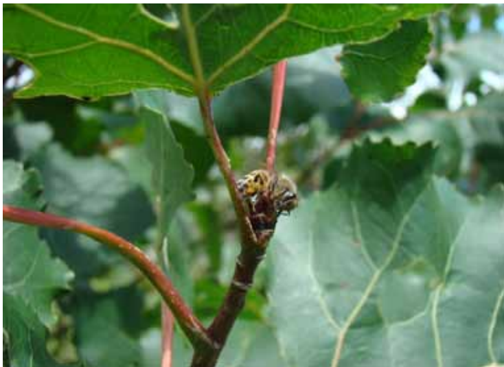
Figura 5. Abelha coletando resina de Álamo