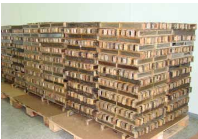
Figura 15. Disposição dos quadros de própolis para a manipulação

Chegando do apiário, as caixas contendo os quadros de própolis devem ser descarregados e levados ao local de processamento. Antes de qualquer manipulação, o apicultor ou a pessoa que irá manipular a própolis deverá tomar todos os cuidados de limpeza e higiene necessários tanto pessoal como do ambiente. Os quadros são retirados das caixas e gradeados na mesa ou prateleira para não haver aderência entre eles e para uma pré-secagem (Figura 15).