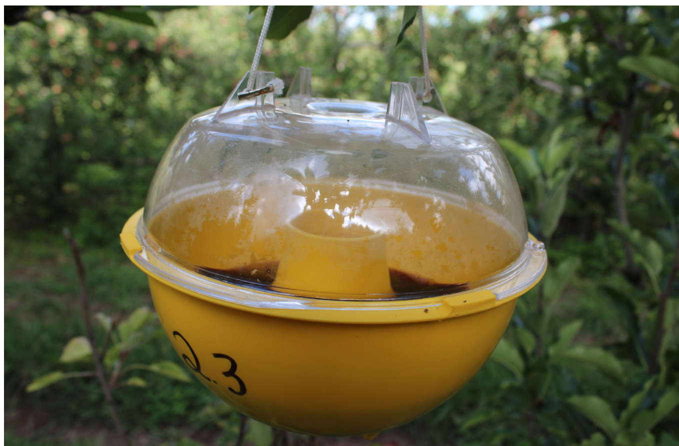
Figura 3. Armadilha MacPhail contendo atrativo líquido usado para o monitoramento de Anastrepha fraterculus em macieira

Entre as pragas secundárias, o pulgão-lanígero e o piolho-de-são-josé estão entre as mais preocupantes. Em relação a essas pragas,