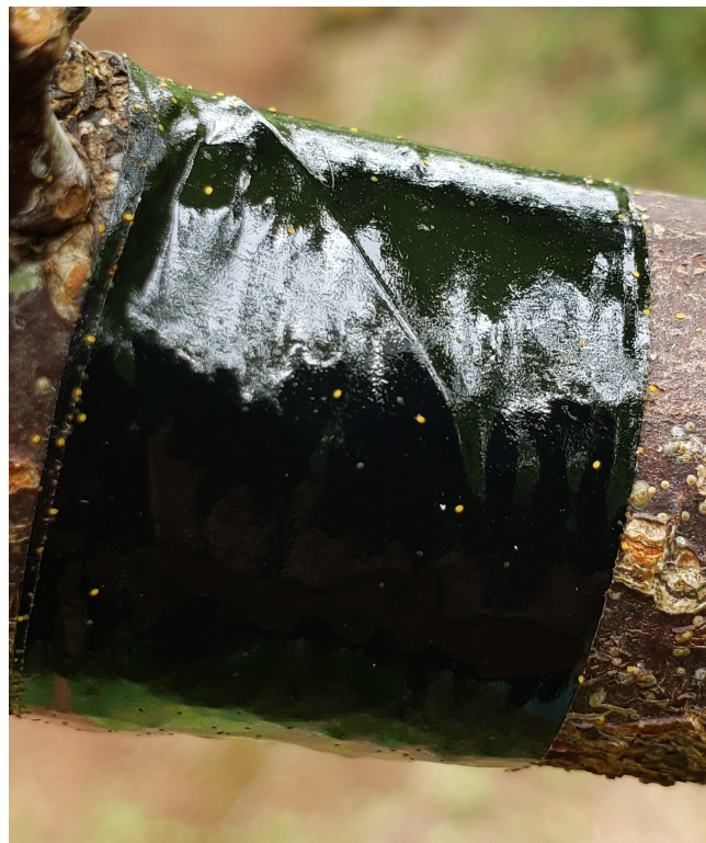
Figura 4. Fita adesiva (posicionada com a face adesiva para cima) para o monitoramento de ninfas móveis da cochonilha piolho-de-são-josé. Os pontos amarelos indicam as ninfas capturadas

Segundo as previsões climáticas, na safra 2023/2024 registraremos maiores temperaturas e precipitação. A chuva é um fator natural de mortalidade de insetos. Entretanto, temperaturas mais elevadas geram maior número de gerações das pragas, o que pode intensificar os problemas, principalmente no período de pré-colheita das frutas. Para grafolita, temos observado que a