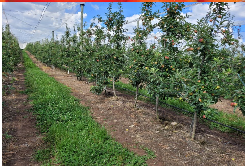
Figura 4. Controle químico no manejo integrado de plantas daninhas em pomares de macieira em formação.