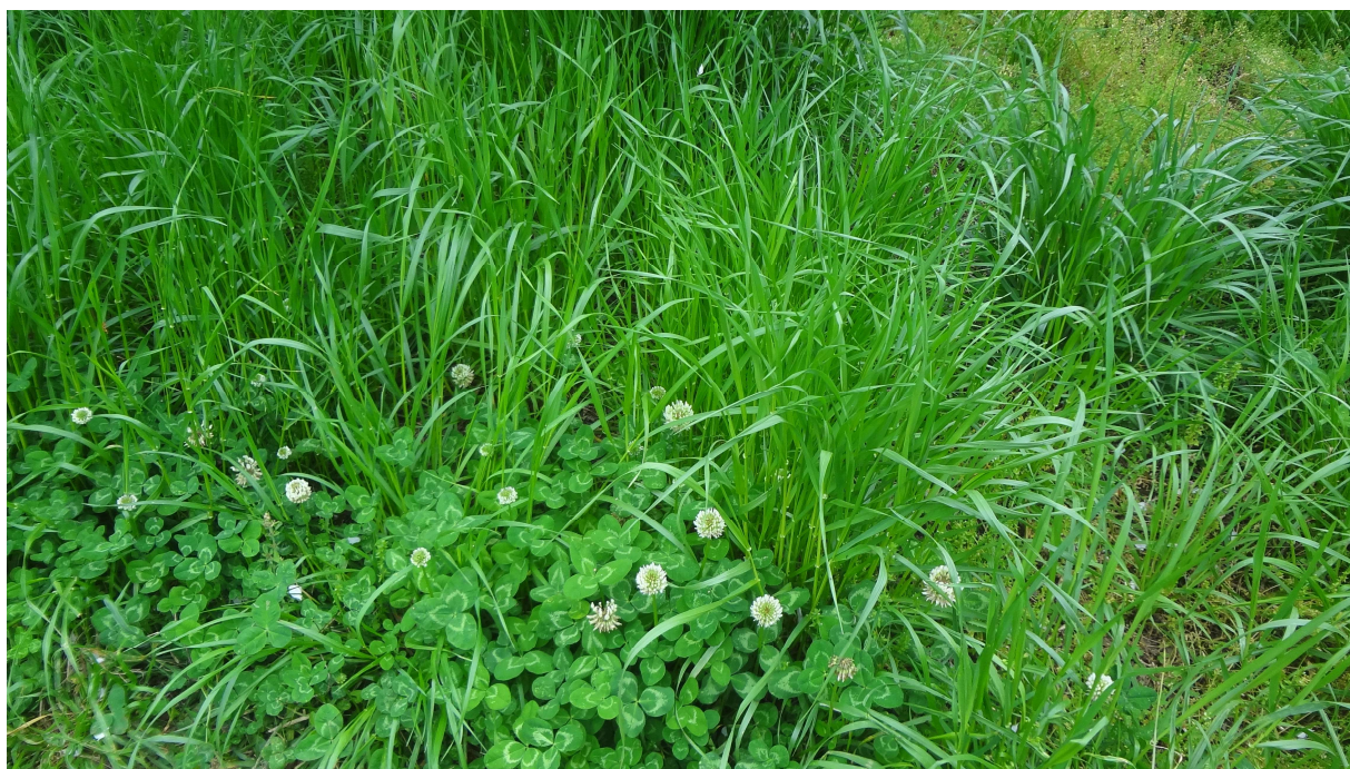
Figura 3. Principais espécies de plantas daninhas na primavera em pomares.